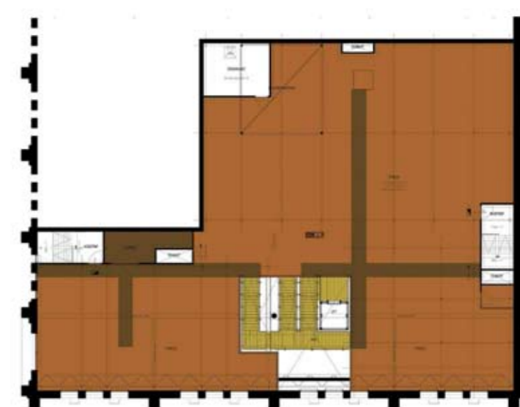
Plattegrond derde verdieping