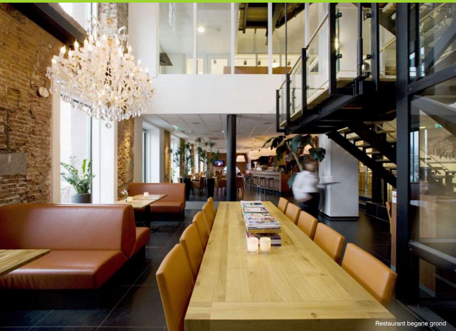
Restaurant begane grond