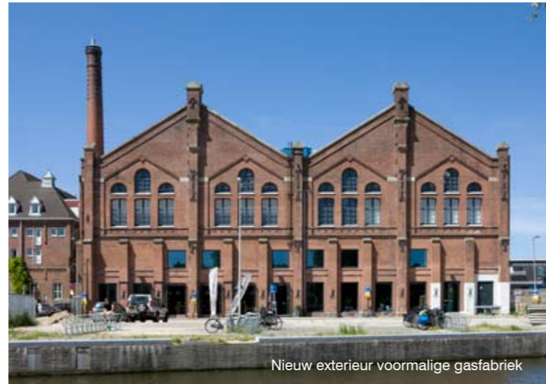
Nieuw exterieur voormalige gasfabriek