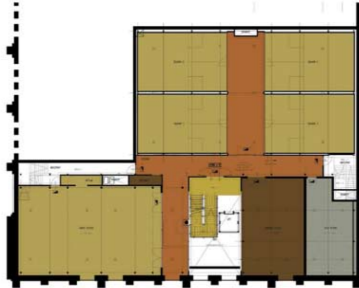
Plattegrond eerste verdieping