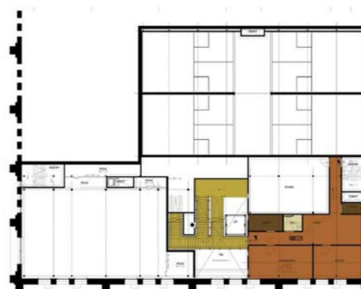
Plattegrond tweede verdieping