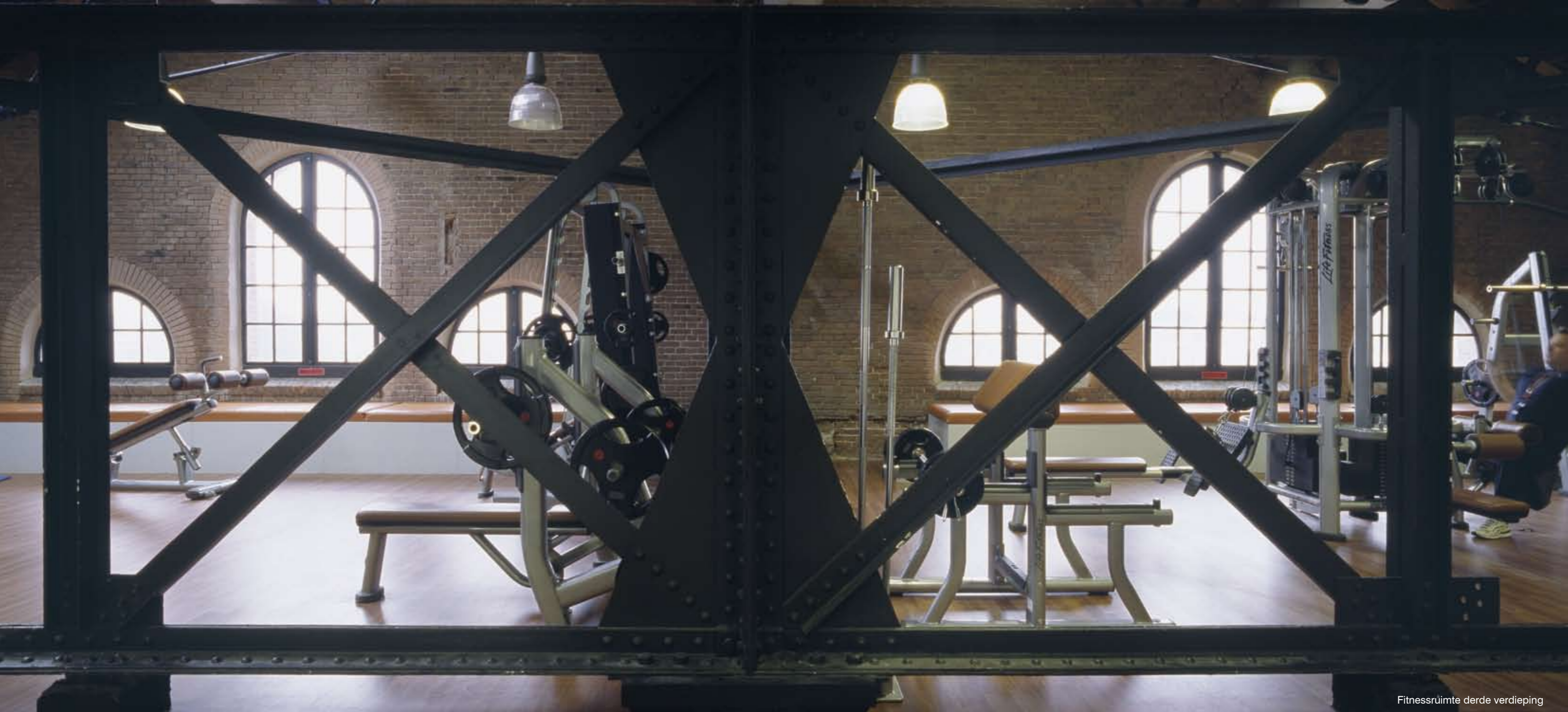
Fitnessruimte derde verdieping